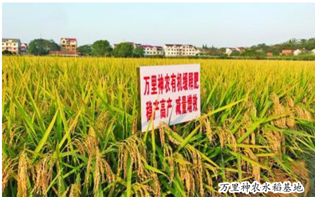
万里神农水稻基地