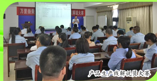
产品生产讲解员大赛