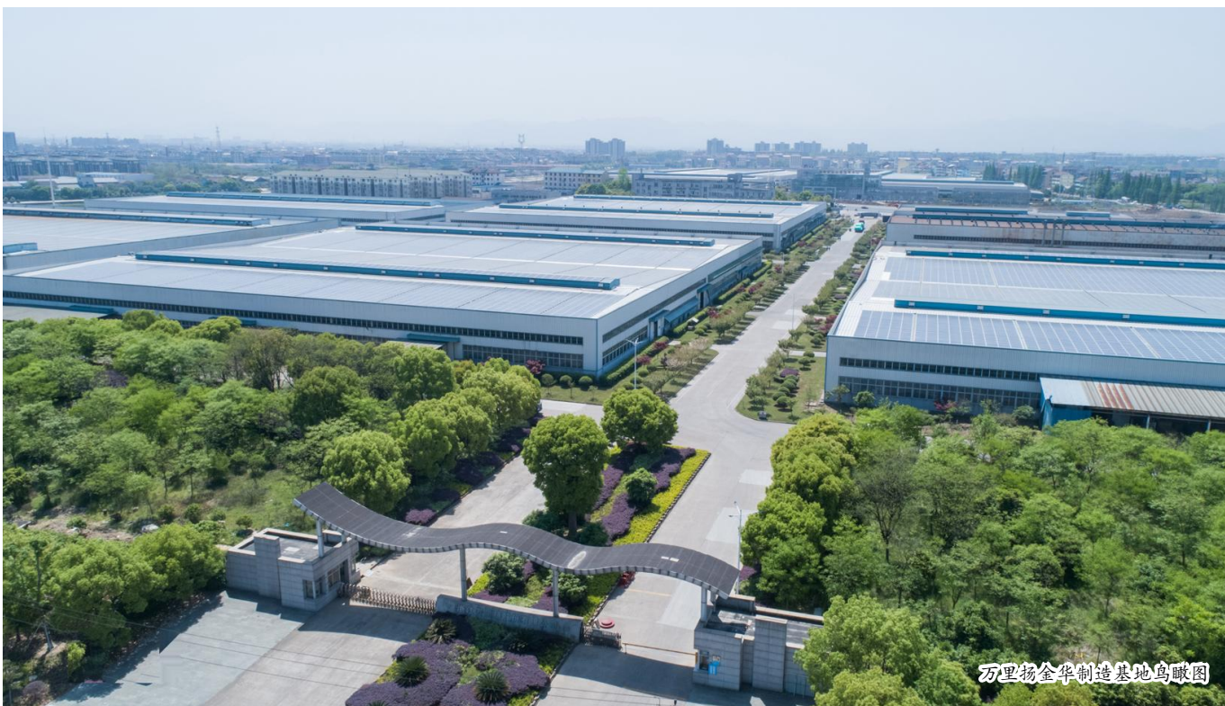
万里扬金华制造基地鸟瞰图

响应八八战略,心无旁骛地坚守实业不动摇,由最初单纯追求数量增长逐渐向追求质量提升转变,从“汗水型经济”走向“智慧型经济”,通过强化创新驱动,向微笑曲线两端升级,以高端化、高品质、高效益的“长跑”节奏,更好地满足客户需求,增加附加价值,提高综合竞争力,真正实现了高质量发展。