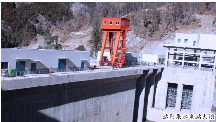
达阿果水电站大坝