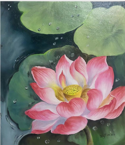
乘变事业部研究院 陈圣良 《清涟凝香》(绘画)