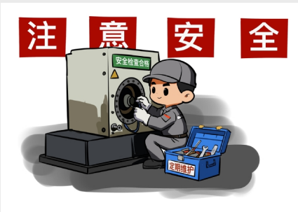
企业管理中心伊惠娟家属 伊璐珂 《安全检查》(绘画)